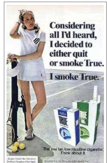
广告诱使吸烟者转吸，而不去戒烟。广告语：“听到这一切，我决定要么戒烟，要么吸True烟。我选择True。低焦油，低尼古丁卷烟。你也考虑一下吧。”