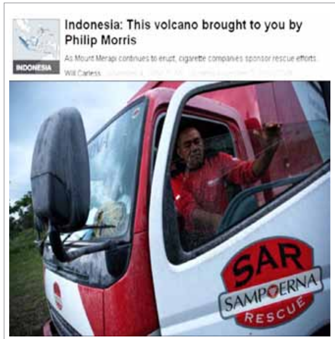
Photo tirée d'un article du Courrier international consacré aux missions de secours de Sampoerna en Indonésie. 33